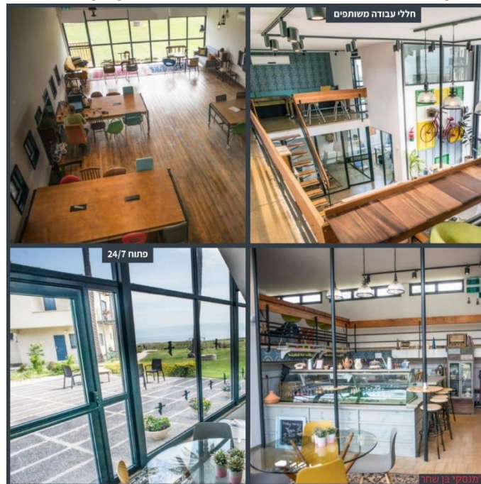
קולאז': מבנה משרדים וחללי עבודה הכוורת - קיבוץ גינוסר

המצוי והצפוי - המרחב הכפרי, הן בצפון הארץ והן בנגב המערבי, שומם וריק מתושבים וממבקרים עד שנחזור לחיים ה"רגילים". השגשוג והצמיחה שאזורים אלה התאפיינו בהם טרם המלחמה נקטע, ובתקווה לחזור לשקט ולשגרה במהרה. "לאחר המלחמה" יהיה צורך בחיזוק העסקים המקומיים ושיקומם, על ידי מתן סיוע נדרש ופיצוי הולם מצד המוסדות והרשויות.