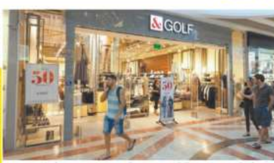
קניון מילריל פלא שבגוש "100 קובוצת הורדן" לא יחלפו באטום שלום. גורלה נחזה בעקבות שוקי המלחה (דויד גבירון)