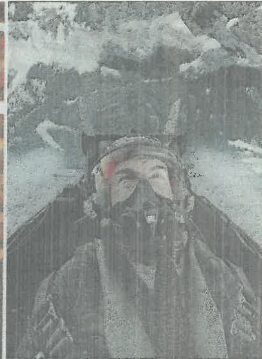
מימין: טום קרוז ב"אהבה בשחקים 2: מאוריק"; גל גדות ב"זונדר וומן 1984"; ווין דיזל ונטלי עמנואל ב"חהיר ועצבני 9". הקרנת הסרטים בישראל נדחתה בכמה חודשים לפחות, ובתלקם אף בשנה

אדרי, שמשפחתו ידועה כמי קורבת לראש הממשלה בנימין נתניהו ולשרה מירי רגב, משוכנע שהמדינה תסייע לענף לצלוח את המשבר: "אנחנו לא לוחצים על מנהיגי המדינה, כי אנחנו סומכים על מקבלי ההחלטות ומאמינים שנקבל פיצוי על התקופה הזאת. בסופו של יום, המדינה תשקול את השיקול הכלכלי, תתחשב בהיותנו משלמי מסים ותפצה אותנו, צריך רק להתאזר בסבלנות".